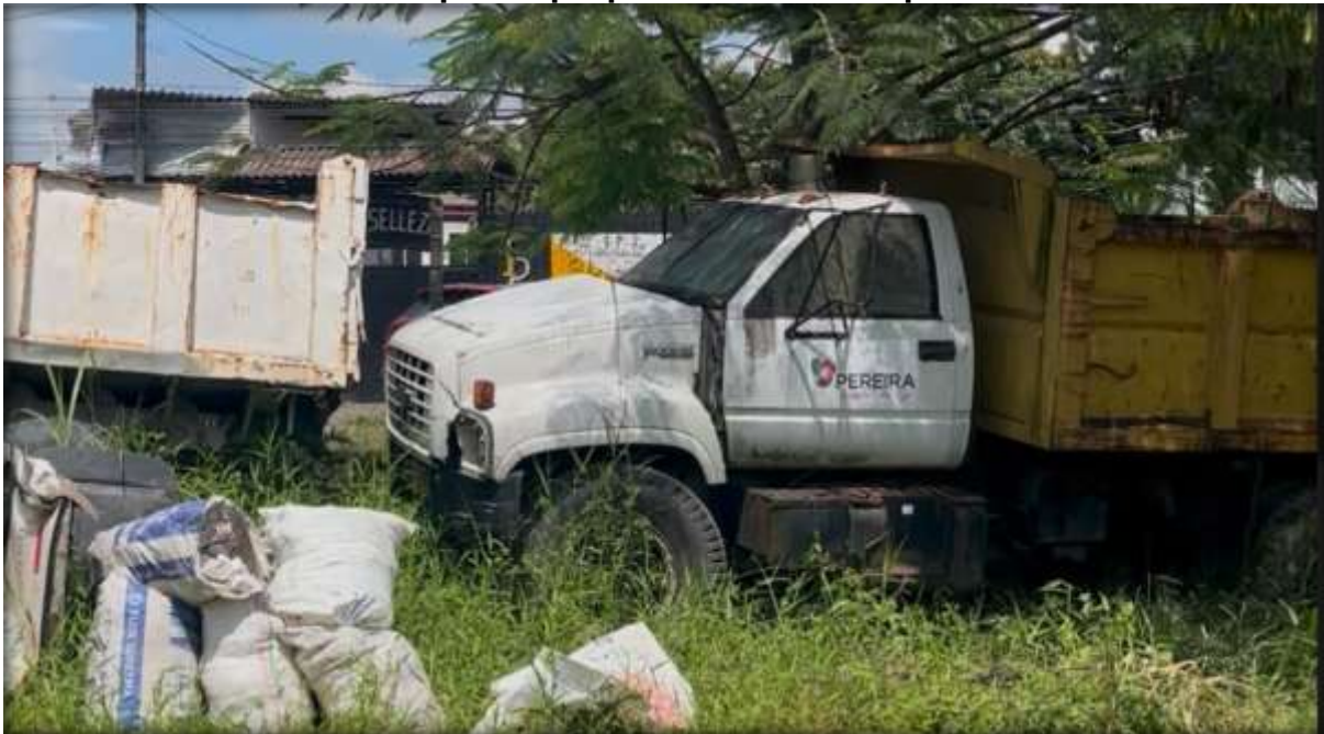
Imagen No. 09 Volquetas propiedad del municipio