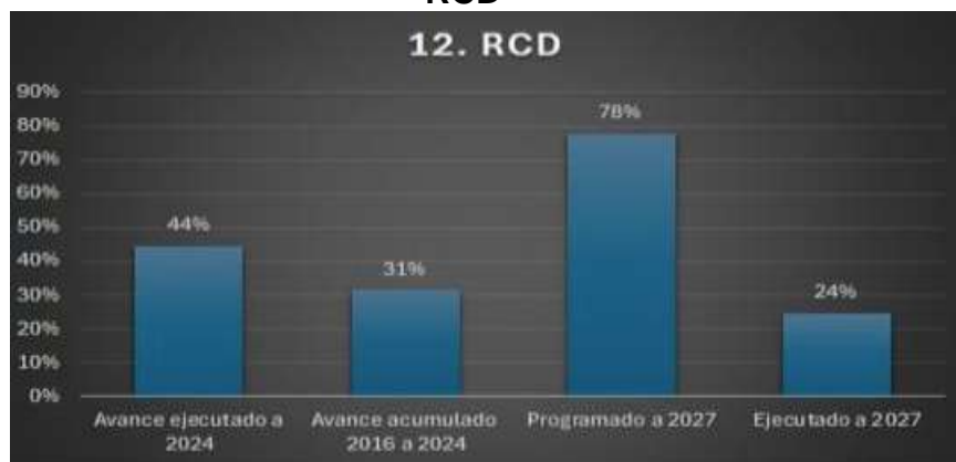
Imagen No. 05 RCD