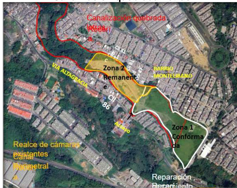
Imagen No. 06 Canalización quebrada Letras