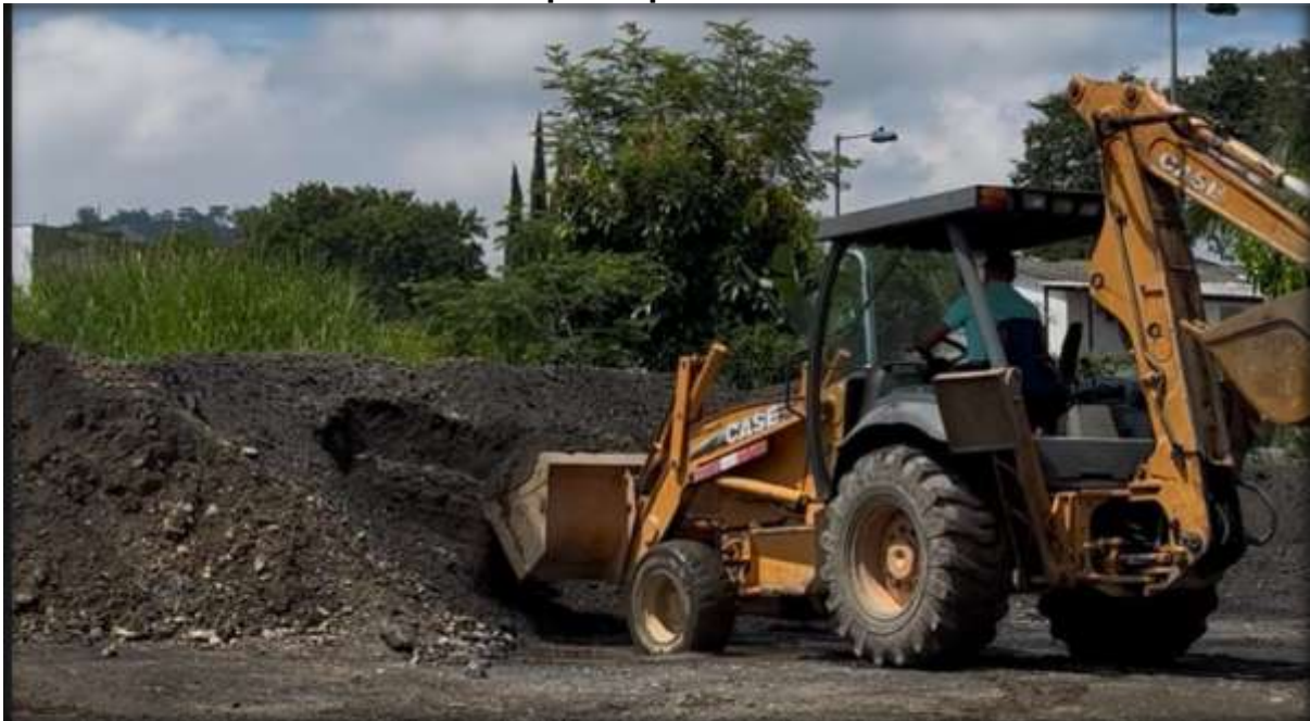
Imagen No. 10 Material fresado para aprovechamiento en vías