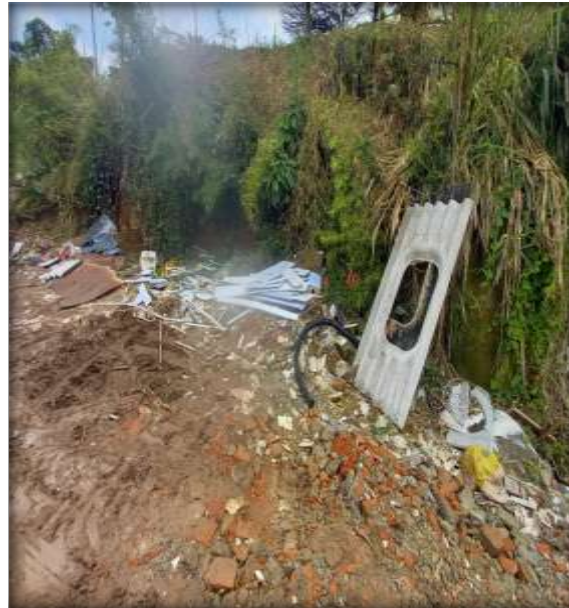
Imagen No. 08 Residuos ordinarios e inservibles