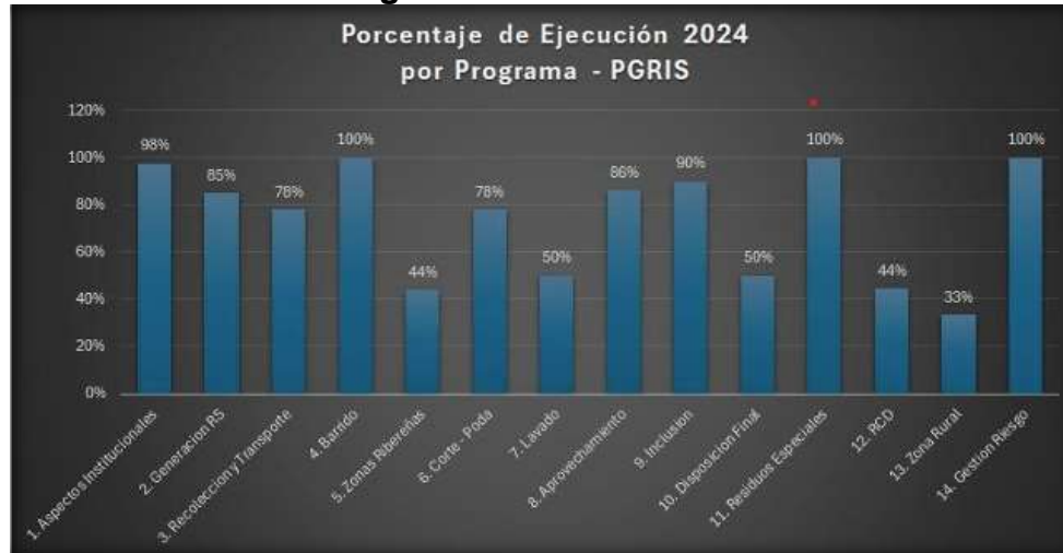
Imagen No. 01 Seguimiento PGIRS 2024