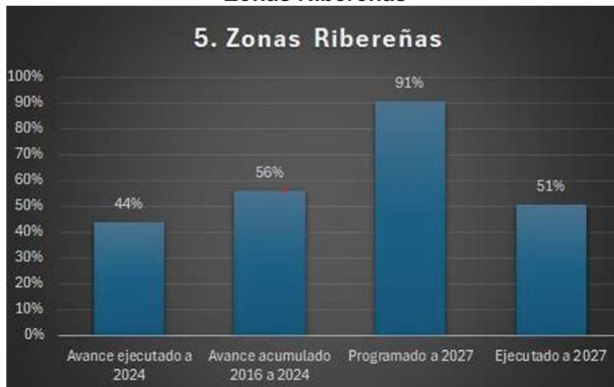
Imagen No. 04 Zonas Ribereñas