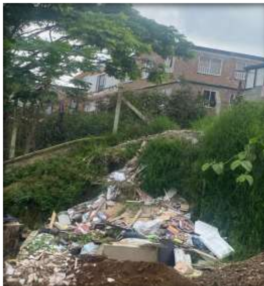
Imagen No. 07 Residuos ordinarios e inservibles